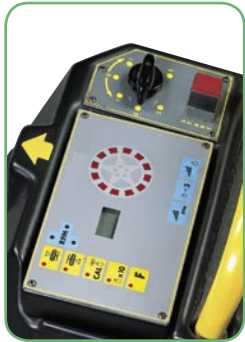
Tablero de mandos integrado con visor digital y teclado

Para facilitar el lanzamiento rueda, el motor de dos velocidades dispone de una junta hidráulica que permite efectuar el lanzamiento gradual sin dañar el costado del neumático.